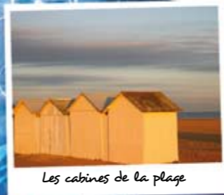
Les cabines de la plage