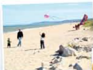
La plage au pas de votre porte !