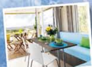
L'intérieur de notre mobil-home

Venez profiter d'un séjour au Point du Jour, garant d'une ambiance conviviale et familiale, en cottage tout confort, originale en hébergement insolite ou authentique sur des emplacements caravanning privilégiés. Au pied d'espaces naturels protégés, des plages du débarquement, de chemins de randonnée, d'activités nautiques ou farniente sur nos grandes plages de sable fin, la Côte Fleurie et Le Point du Jour vous accueillent pour des moments de détente inoubliables.