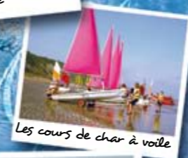
Les cours de char à voile