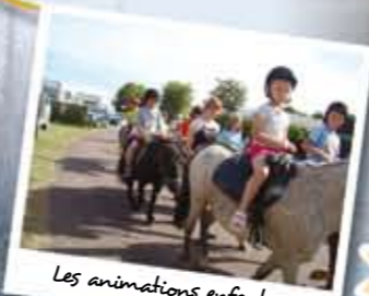
Les animations enfants