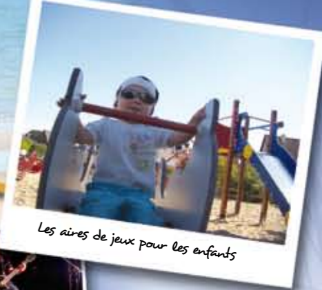
Les aires de jeux pour les enfants