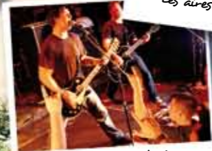
Les soirées / spectacles