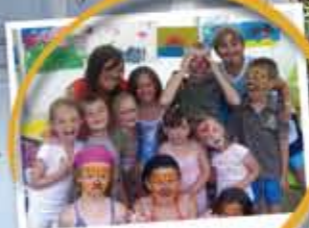
Le club enfants

Sei es der Komfort eines Landhauses, die Originalität einer mongolischen Jurte am Meeresufer oder die Ursprünglichkeit eines Campingaufenthalts - Sie werden der geselligen und gemütlichen Stimmung bei uns im Le Point du Jour zu schätzen wissen. Vor den Toren der Naturschutzgebiete und der Landungsstrände (der Alliierten während des 2. Weltkriegs) können Sie den Wassersport, die Wanderung, oder das Dolcefarniente an unseren großen feinen Sandstränden genießen. Die «Côte Fleurie» (Blumenküste) und Le Point du Jour erwarten Sie, um ihnen unvergessliche Entspannungsmomente zu bieten.