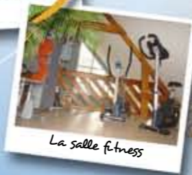
La salle fitness