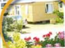
Des emplacements soignés...