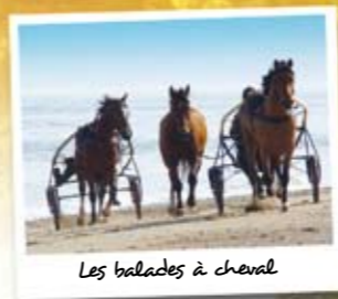
Les balades à cheval

e.mail : contact@camping-lepointdujour.com www.camping-lepointdujour.com