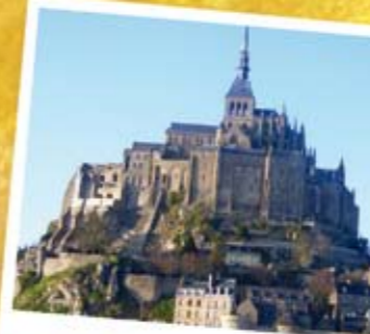
Le Mont Saint-Michel